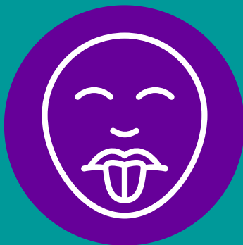
Falta del gusto y del olfato